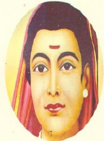
प्रथम शिक्षिका सावित्रीबाई फुले